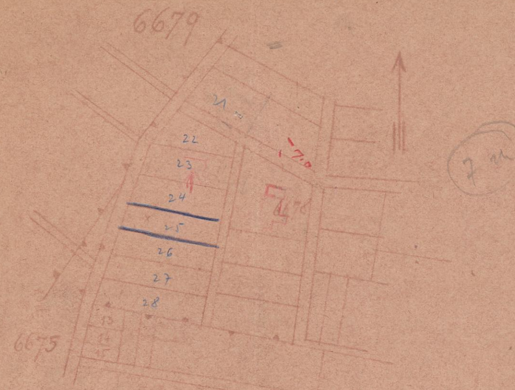
תרשים חסביוח ק.מ. 1:5000